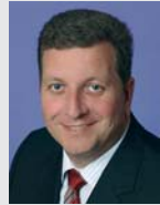
Christian Bernreiter Landrat des Landkreises Deggendorf